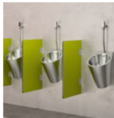
Exemple d'installation Urinoir Inox FINO