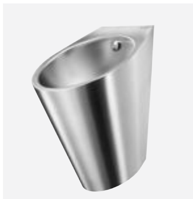
Urinoir design Inox FINO Réf. DELABIE : 135710

Illustrations disponibles sur notre site internet delabiebenelux.com , rubrique Presse