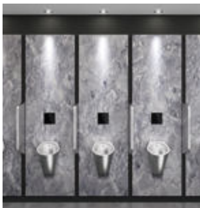
Exemple d'installation Urinoir Inox FINO