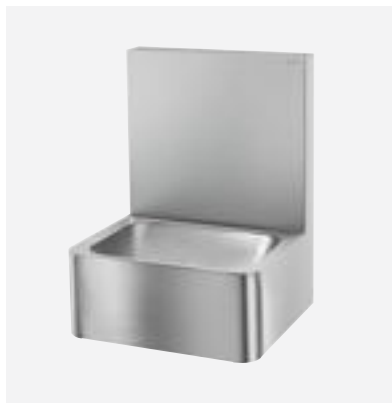
Lave-mains Hygiène en Inox

Illustrations disponibles sur notre site internet delabiebelux.com , rubrique Presse