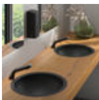
Vasque ronde à encastrer HEMI noire mat réf. 120490BK

Découvrez la nouvelle gamme DELABIE d'appareils sanitaires en Inox finition Téflon® noir mat.