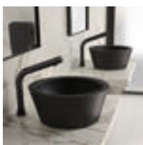
Vasque à poser ALGUI noire mat réf. 120110BK