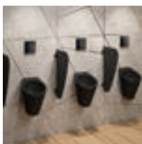
Urinoir FINO noir mat réf. 135710BK