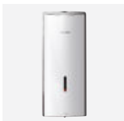
Distributeur de savon liquide électronique

Nouveau distributeur de savon automatique