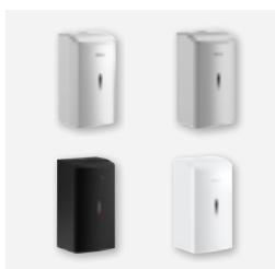
Design : disponible en 4 finitions