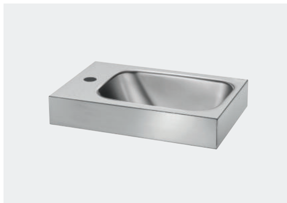
Lave-mains WC LAVANDO

Illustrations disponibles sur notre site internet delabiebenelux.com , rubrique Presse