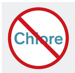
Choc chimique inefficace à terme