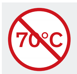
Choc thermique inefficace à terme