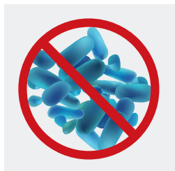
Hygiène et maîtrise de la prolifération bactérienne