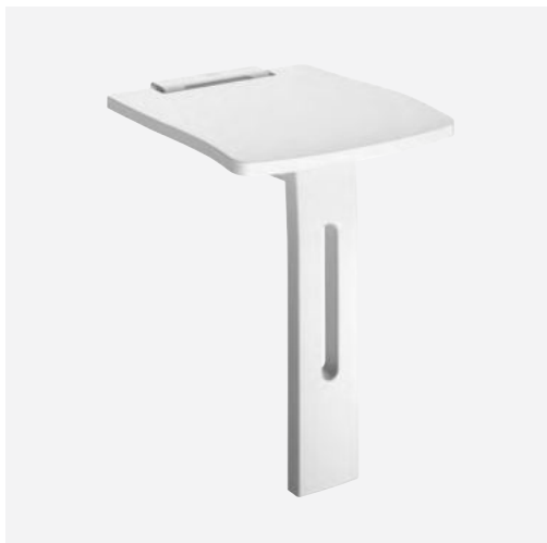
BASIC+ douchezitje Ref. DELABIE: 510405

Afbeeldingen zijn beschikbaar op de website delabiebelux.com , rubriek Pers